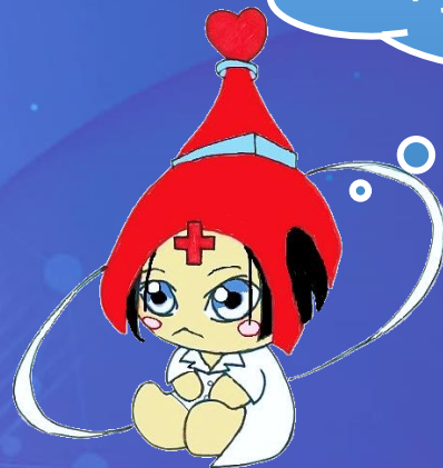
ナビゲーター：としやくん