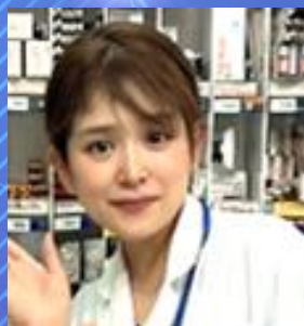
資料作成：大舘 祐佳